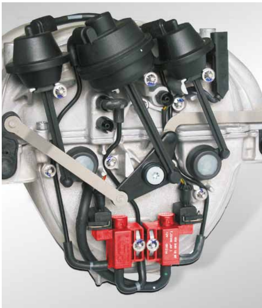
Anwendungsbeispiel: Saugrohr mit elektropneumatischen Ventilen (rot hervorgehoben) in der Mercedes C-Klasse

Die gebräuchlichsten dieser Ventile sind auf den nachfolgenden Seiten aufgeführt.