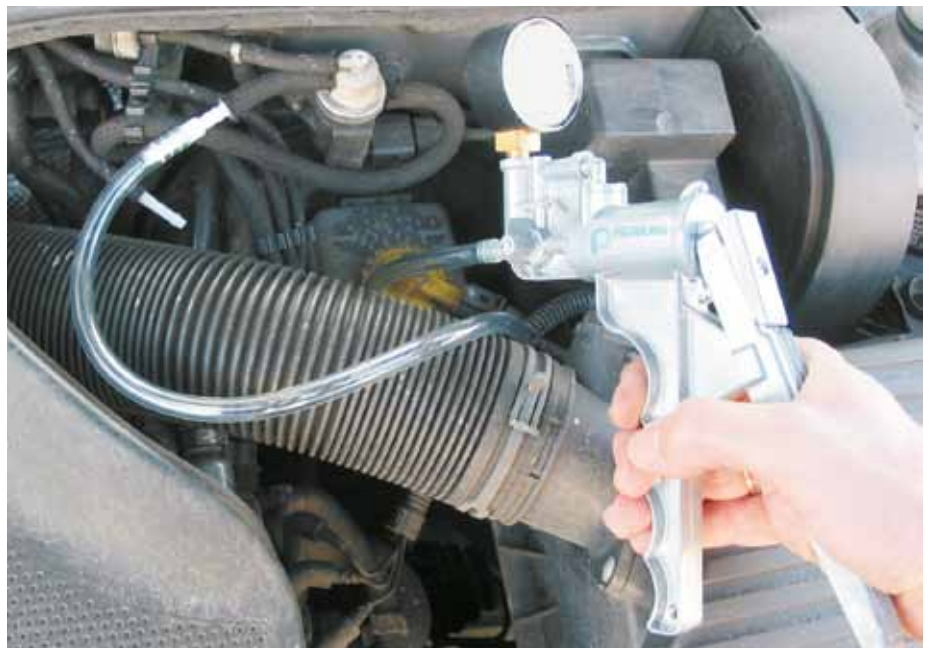
Prüfung eines EPW mit der Hand-Unterdruckpumpe (VW Golf IV)

Elektropneumatische Ventile werden durch die OBD (On-Board-Diagnose) nicht auf Funktion, sondern nur auf Durchgang, Kurzschluss und Masseschluss überwacht. Fehler werden dadurch nicht sicher erkannt und Störungen oft anderen Bauteilen zugeschrieben.