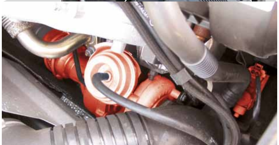
EPW und VTG-Lader (rot hervorgehoben) im Audi A4 TDI