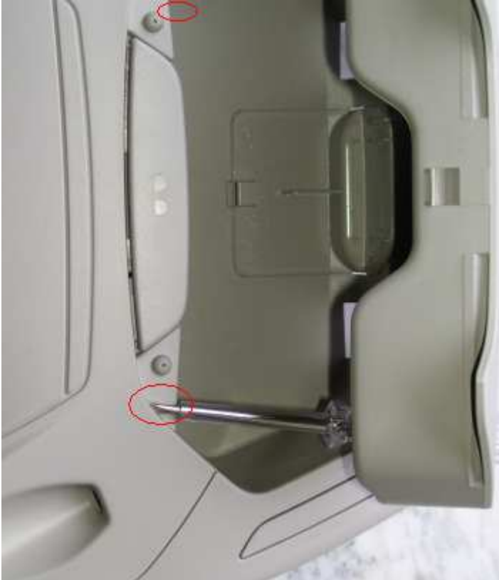
Abbildung 3: Der Schraubenzieher soll nur die Stelle markieren. Da das aufgeklappte Brillenfach im Weg ist, empfehle ich 2 Nägel mit 2 mm Durchmesser. Wie es funktioniert, wird noch gezeigt.

Um diese abzunehmen, sind bei heruntergeklapptem Brillenfach 2 Löcher zu sehen.