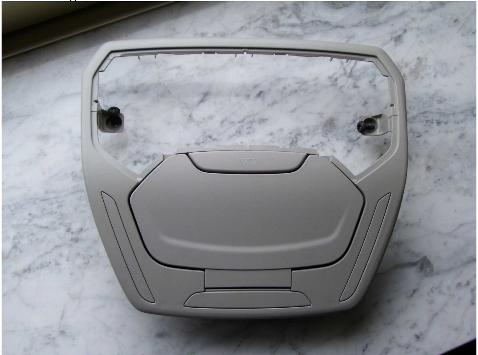
Abbildung 1: Brillenfach ohne Abdeckklappe.