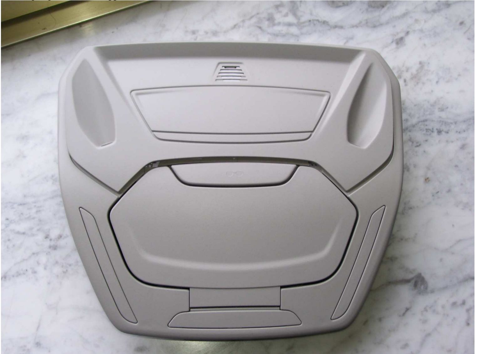
Abbildung 2: Brillenfach mit(!) Abdeckklappe. Die Klappe ist auf diesem Bild nicht eingerastet